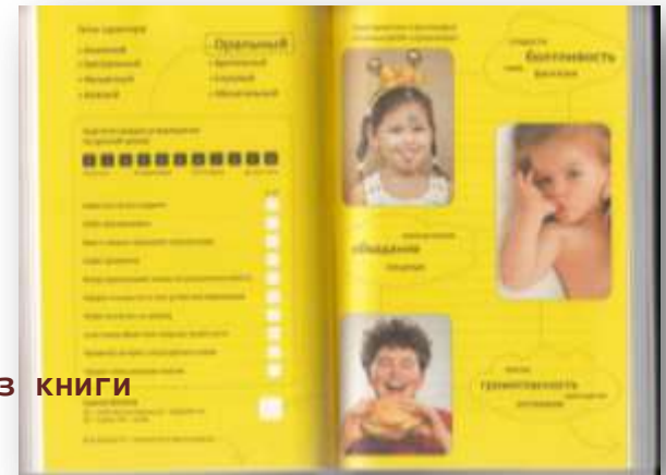
Иллюстрация из книги