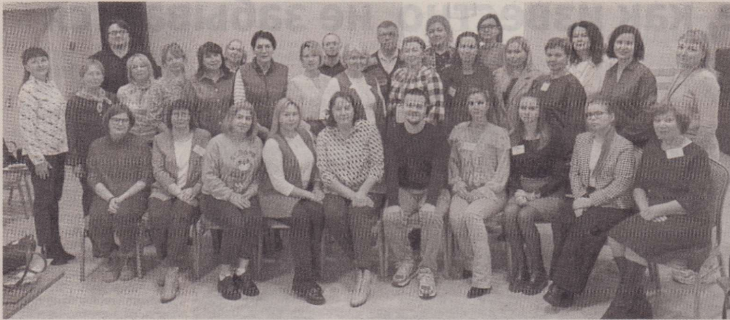
Библиотекари – участники семинара